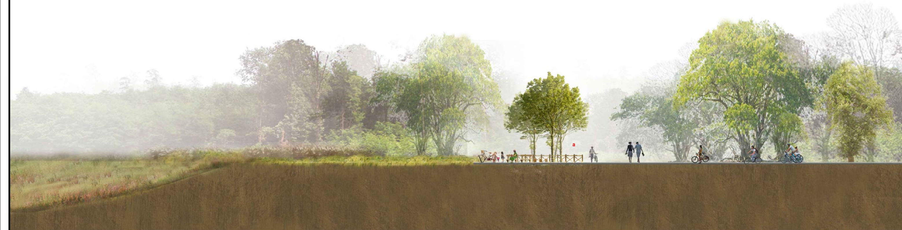
Sezione _ Scala 1:200