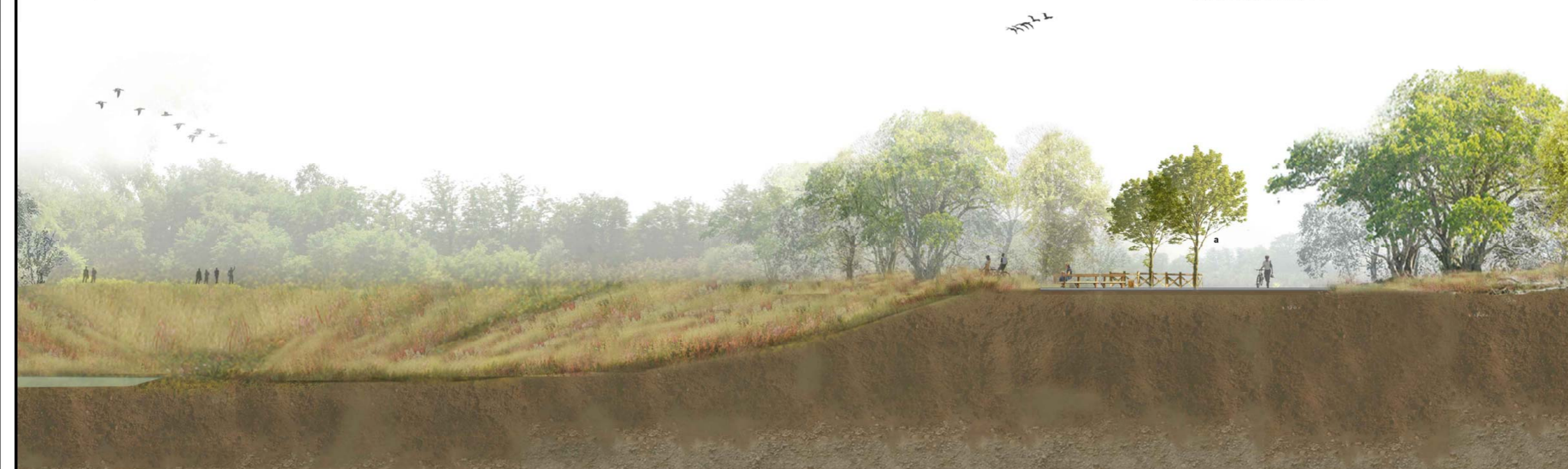
Sezione _ Scala 1:200