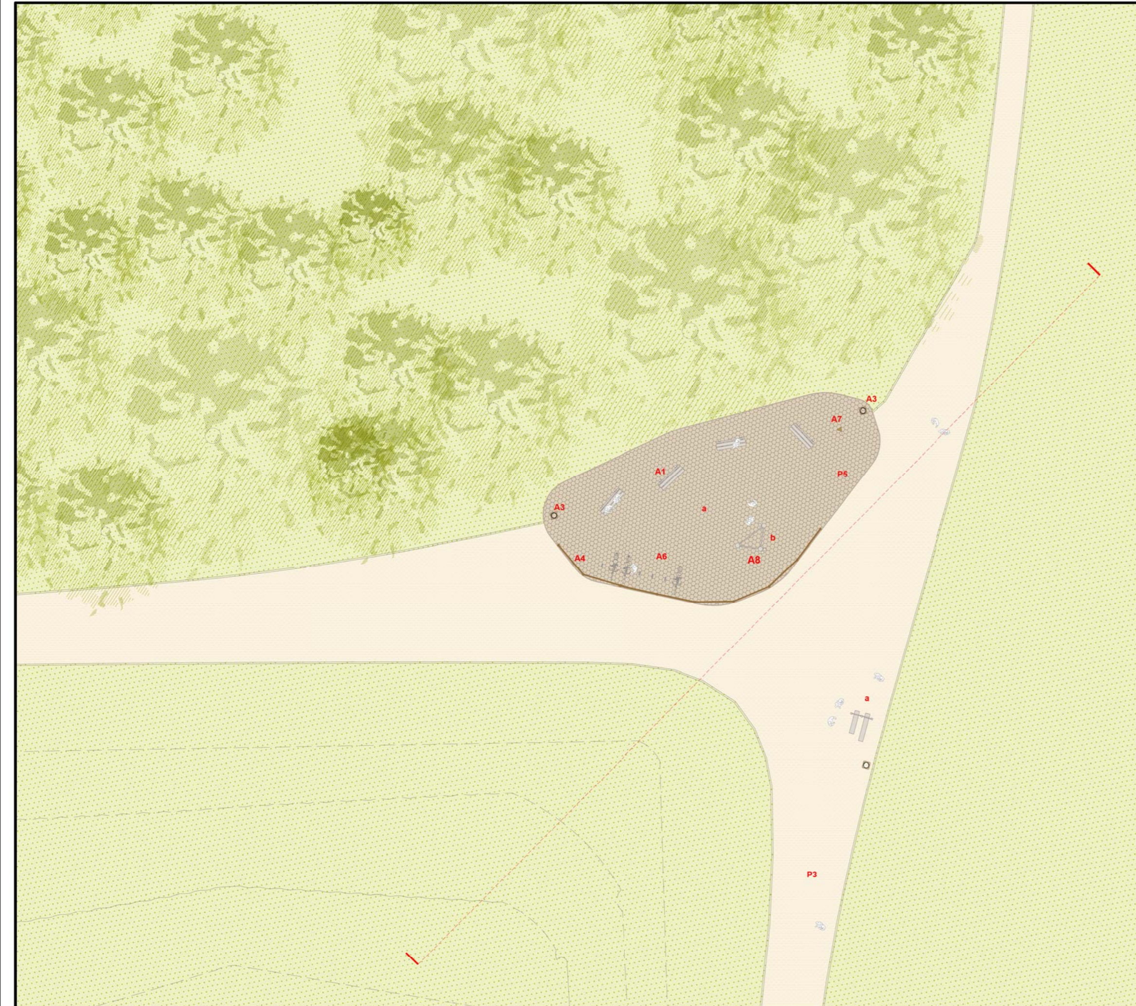
Planimetria _ Scala 1:200