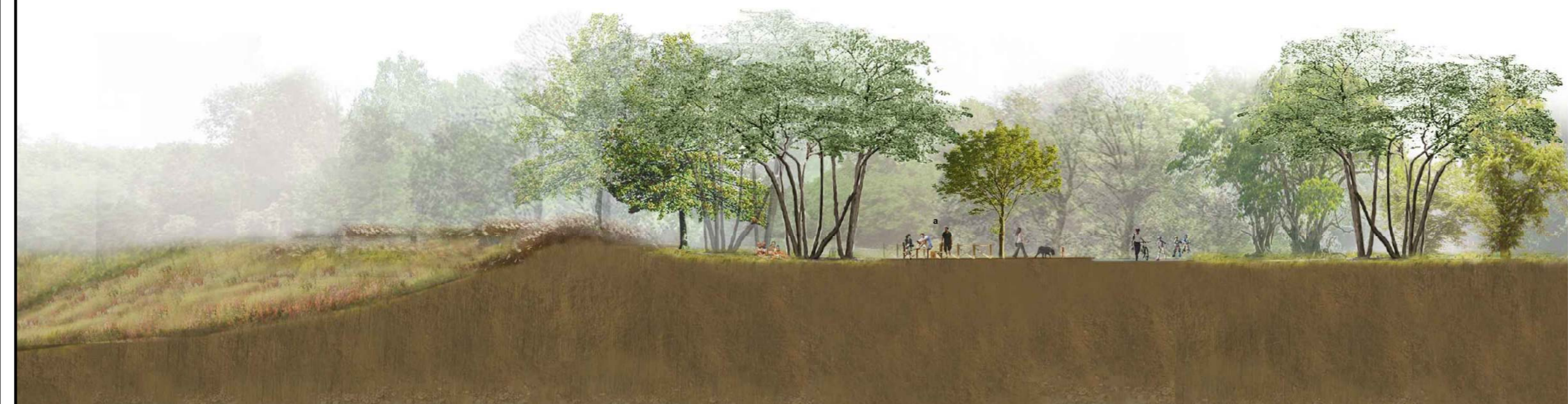
Sezione _ Scala 1:200