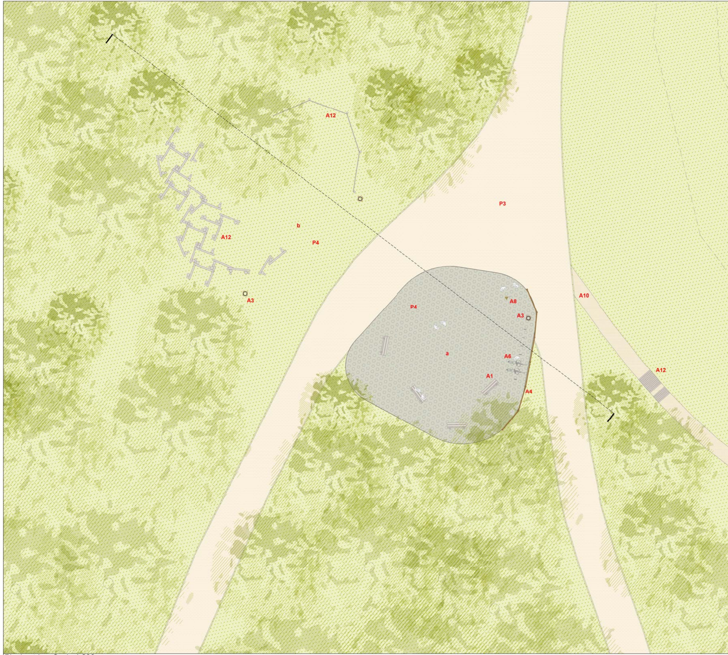
Planimetria _ Scala 1:200