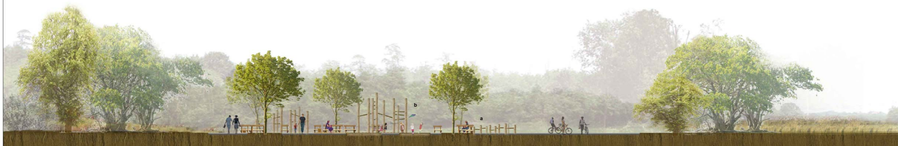
Sezione _ Scala 1:200